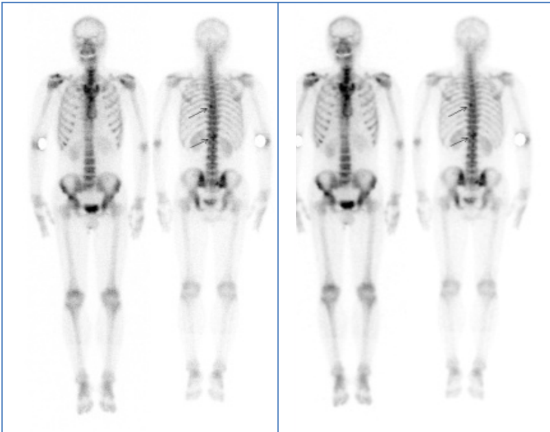
Cabeçote único 30 minutos*, anterior e posterior

Permite reduzir o tempo de aquisição a um tempo comparável ao do equipamento de dois cabeçotes em muitos procedimentos comuns